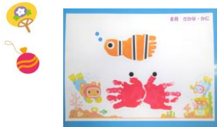
8月の手形・足形アートは「さかな・かに」