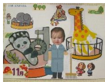
今月のテーマは「どうぶつえん」