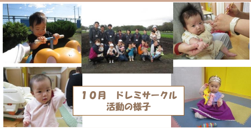
10月 ドレミサークル活動の様子

＊ドレミ通信は、イオンスーパー十和田・保健センター・東/南コミュニティセンターに置いてあります。また、市役所のホームページから、市内の7園で行なっている支援センターの通信が見られます。